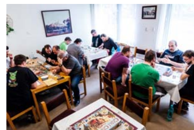
Účastníci ZatroCONu 2017.

všem hráčům deskových her přinášet nejkvalitnější informace z tohoto světa.