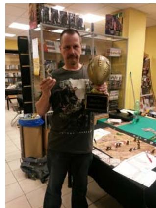
Cauly ovládl Blood Bowl v Ostravě.