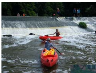
^ Korunkovské červené kanoe.

Všichni přátelé Korunky jsou srdečně zváni. V případě zájmu není nic lehčího, než napsat na e-mail korunka.deskovky@seznam.cz.