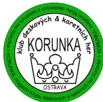
Nové logo magazínu Korunka

ném stavu. K tomuto kroku se redakce dvoutměsíčníku rozhodla za účelem odlišit sdělení pocházející přímo z klubu Korunka a jejího magazínu. Jakmile se tedy bude hovořit o magazínu Korunka, mělo by se vždy jednat právě o výše zmiňované logo.