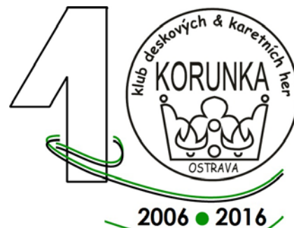
Oficiální logo Trachtace 2016, desátých narozenin klubu Korunka.

Pokud ještě nejste přihlášení a máte chuť slavit s Korunkou, zabalte si spacák a stan, brkněte Delimu či Caulymu a přijďte. Budete vítáni!